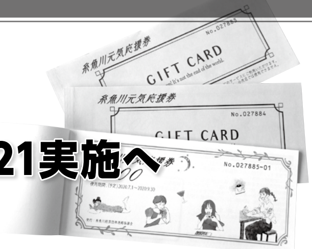
写真は前回のもの

購入申込みは、前回と同様、専用の申込みハガキによる事前申込方式で発行予定冊数を上回った場合は抽選または調整が行われ、余った場合は9月5日(日)に対面販売で販売します。