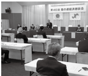
塩の道経済懇談会の様子

その後中信会館ベルヴィホールを会場に懇談会が行われ、松本糸魚川連絡道路の早期建設に向けて連携を強化していくことを確認しました。来年度は糸魚川市を会場に開催される予定です。