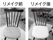
「家具リメイク」椅子をよみがえらせた

ご興味のある方は要予約となりますので、まずはお電話をしてみてくださいいかがでしょうか。