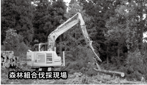
森林組合伐採現場