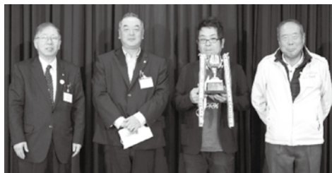
部会優勝 観光・サービス業部会