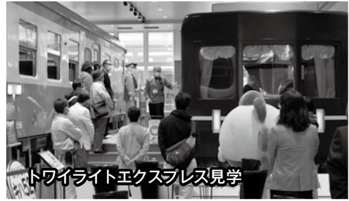
トワイライトエクスプレス見学