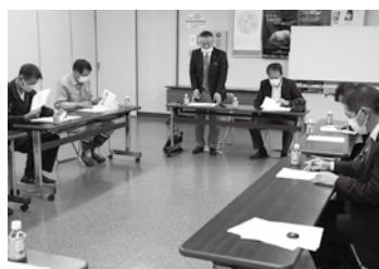
運輸・港湾業部会