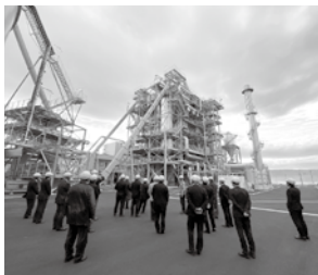
ソヤノウッドパーク 木質発電所の見学