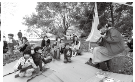
絵本の読み聞かせ