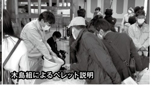
木島組によるペレット説明