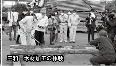
三和 木材加工の体験