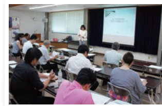
販路開拓セミナー