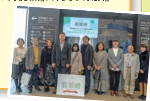
昨年のツアーの様子▶

ブライダルデーとして結婚25周年を「銀婚式」、50周年を「金婚式」とされており、35周年は「翡翠婚式」とされています。結婚35年夫婦に「夫婦円満」「絆の再認識」「仲良し家族」の機会にしてほしいという思いを込めて「翡翠婚の旅」を行いました。上越地域に住んでいる方を対象に5組のご夫婦から楽しんでいただきました。