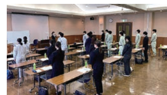
新入社員ビジネスマナーセミナー

各地商工会議所には、中小企業相談所が設置されています。中小企業相談所は、国の経営改善普及事業を推進し、地域の中小、小規模事業者の経営改善を支援しています。 中小企業相談所には、経営指導員、記帳専任職員などが配置されていて、事業者の経営に関するさまざまな問題に対して無料で相談に応じています。さらに、相談内容によっては、中小企業診断士、弁護士、税理士などの専門家を紹介したり派遣する制度もあります。 平成27年度からは特に小規模事業者に焦点を当てた「経営発達支援計画」を策定し、小規模事業者が地域の中で持続的に発展していけるよう経営指導員が事業者に寄り添い、一緒になって経営を支援する事業に取り組んでいます。