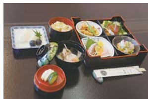
好評、魯山人の料理を再現

糸魚川街なか 魅力アップ推進会議 ☎025-552-1225 (糸魚川商工会議所内)