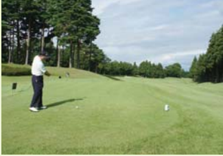
ナイスショット！猪又会頭の第1打

糸魚川商工会議所会頭杯争奪第25回会員ゴルフ大会が、8月30日糸魚川カントリークラブで開催されました。不安定な天候が続くなか、当日はくもり空の下、66名の方から参加頂きました。心地よい風が吹き、プレーのしやすい日となりました。パーティーでは会員同士の交流と親睦を深めました。