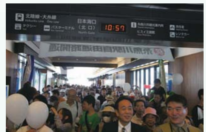
H26.9.14 糸魚川駅自由通路開通式