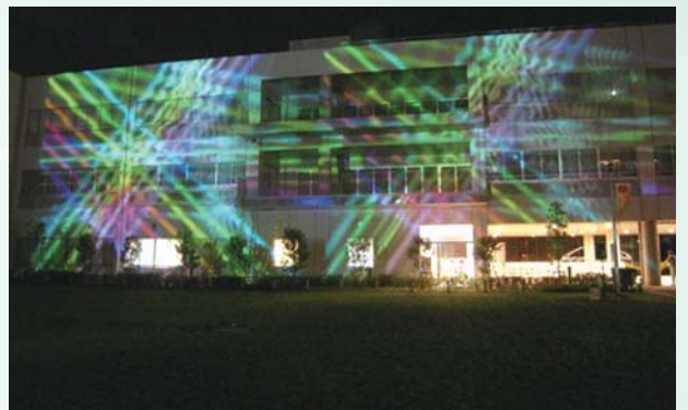
前夜祭では映像・照明演出を予定(写真はイメージ)