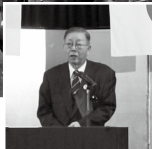
猪又会頭による年頭の挨拶