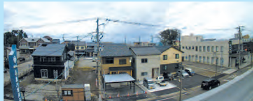
平成30年9月30日時点 賑わい創出広場周辺（定点カメラ）