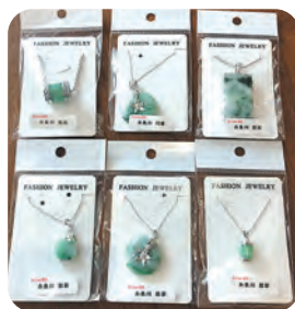
おすすめのヒスイ商品

糸魚川市大町2-3-45 TEL025-552-0557 営業時間9:00~17:00 無休