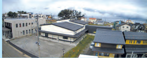
平成30年9月30日時点 木伊京屋様周辺（定点カメラ）