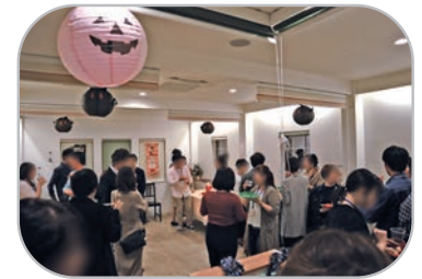
フリータイム風景