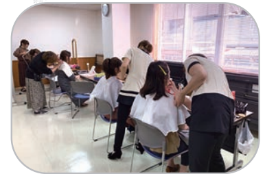
事前魅力アップレッスン風景

また、アンケート等を参考に、より良い交流事業となるよう次年度も取り組んでいく予定です。