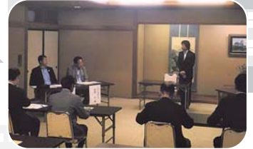
六商工会連合会総会

六商工会連合会は、5月30日をもって解散し、六商工会連合会に加盟していた押上・寺町商工連盟が広域商店街へ新たに加盟、六商工会連合会で行なっていた事業も広域商店街が継続して実施することとなりました。