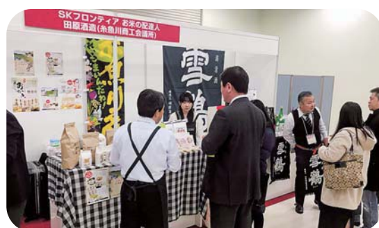
過去出展した商談会の様子 平成30年1月 居酒屋 JAPAN