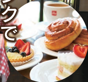
スイーツの写真はイメージです