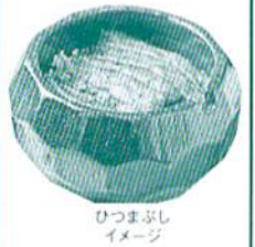
ひつまぶし イメージ