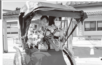
▼人力車試乗の様子