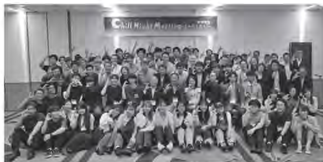
R5.9.29 東京グリーンパレスで開催したチルナイトミーティング 2023

新事業展開などを後押しし、将来にわたり持続して経営が続けられるよう支援していく所存であります。