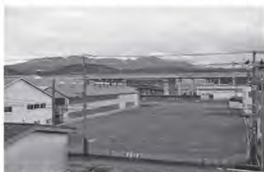
ホテル建設予定地

現時点では、これ以上の提供できる情報は無いとのことですが、用地取得が確定したことから、今後、ホテル建設に向けて工事が進められていくこととなります。