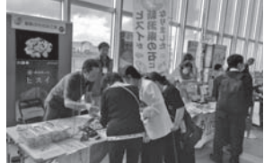
全国の人にヒスイをアピールしました