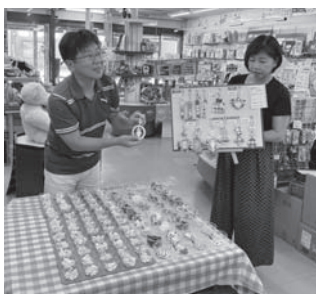
お名前プレート作り(ヒノキヤ)

第12回目となる知って得するゼミナール「知っ得ゼミ」が、7月28日～9月27日の期間中、17店、17講座が開催されました。