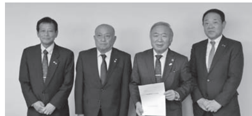
右から 高瀬会頭、米田市長 大賀能生商工会長 尾崎青海町商工会長