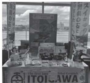
ヒスイ県石指定記念実行委員会

他市町村のブースもおみや日本酒の販売で賑わっていました。出展にご協力頂いた皆さまお疲れ様でした。