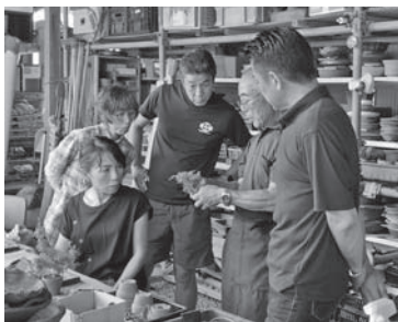
ミニ盆栽の作り方(片岡ガーデン)

また、講師となった店主からは「お客様と一緒にコミュニケーションが取れたので良かった」、「新規のお客様でその後の来店につながった」、「これからも市民の皆様様に体験していただきたい」、「悩みを相談されたり、お客様に喜んでもらえて良かった」などの感想がありました。